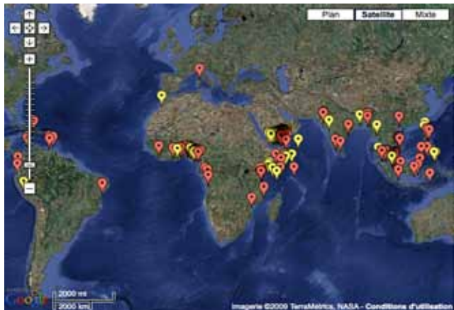
Geografische Standorte von Piratenattacken 2008, Google 2008

Seitdem internationale Handelsschiffe die Meere kreuzen, tummeln sich auch Piraten in denselben Gewässern.